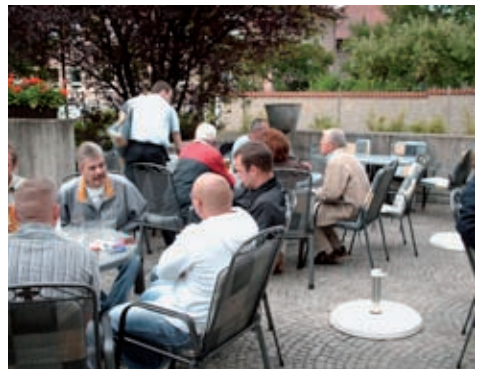
Ob drinnen oder draußen, zu erzählen gab es viel