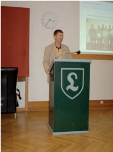
Der 1. Vorsitzende resümiert positiv und weist optimistisch in die Zukunft