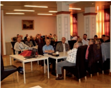
Die Mitglieder hören interessiert zu