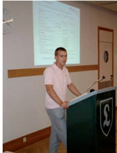
Der Schatzmeister: „Die Bilanz stimmt!“